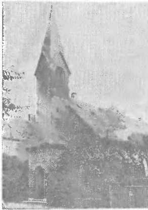
1877 -- 1952 Martinskirken